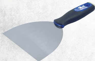
Réf. 4158 COUTEAU À ENDUIRE