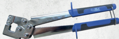
Réf. 4320 PINCE À SERTIR POUR PROFILÉS