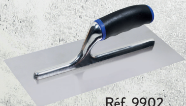
Réf. 9902 PLATOIR