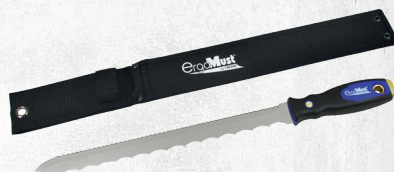
Réf. 4296 COUTEAU LAINE DE VERRE