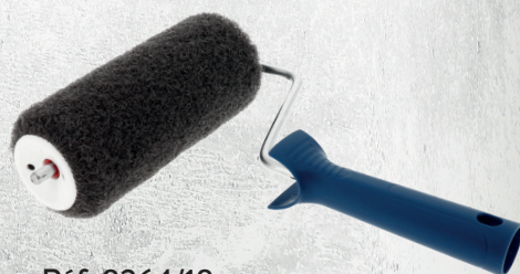
Réf. 8264/18 ROULEAU À ENDUIRE 180 MM